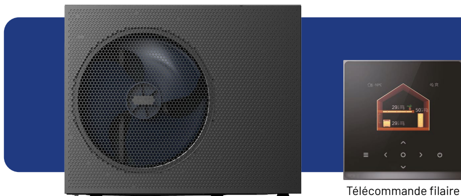
Télécommande filaire classe 6 de série