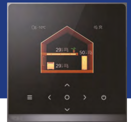
Télécommande filaire classe 6 de série